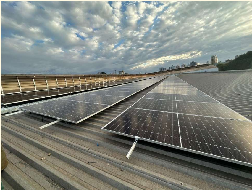
PLACAS SOLARES UNIDADE MARINGÁ